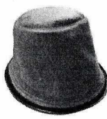
FILTRO DE TECIDO LAVÁVEL ASPIRADOR KÄRCHER