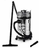
Aspirador de Pó e Água Kärcher NT 3100

ATENÇÃO: Opções de frete acima apenas para consulta. A opção deverá ser selecionada nas próximas telas, na finalização do pedido. Clique no botão "comprar" acima, depois em "finalizar compra" e siga os procedimentos solicitados.