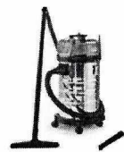
Aspirador de Pó e Água Kärcher NT 3100